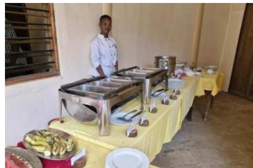
Amboseli Sopa Lodge - Amboseli