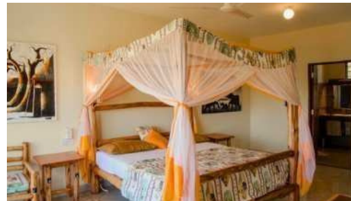
Voi Safari Lodge - Tsavo East