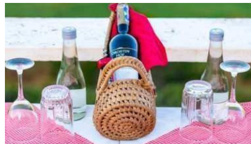
Boma Simba Lodge - Tsavo East